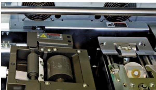
Bac polyuréthane téflonné